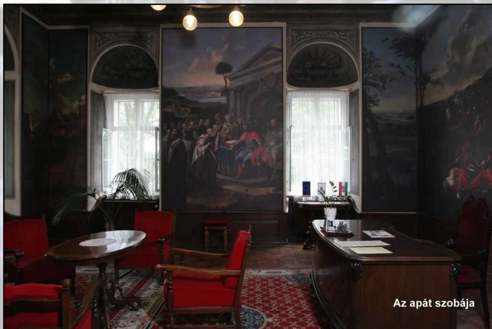
Az apát szobája