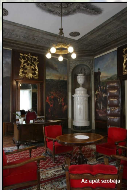
Az apát szobája

Az épület egyik legszebb helyiségébe a zárt belső udvaron keresztül juthatunk be. Az előtérben feltűnik szépségével a kagyló formájú vörösmárvány kézmosó. A refektórium bejáratától jobbra található egy 1800 körül készült díszes cserép-kályha. A falakat borító lambéria vonalából kiemelkedik a berakásokkal díszített szószek, amelyen elhelyezkedve egy szerzetes olvasott fel társainak az étkezések alatt. A szemközti falon Dorfmeister alapítást ábrázoló festményének egy másolata látható. Eredeti viszont a terem mennyezetképe, amely városunk névadóját, Szent Gotthárdot ábrázolja, amint felajánlja az apátságot Szűz Márián keresztül a Szentháromságnak. Gusner műve Pilgram építészternök tervei alapján készült, rajta megfestette a kolostorépület északi szárnyát is, ami azonban nem épült fel. Ma ez a szépen felújított terem a házasságkötések és számtalan kulturális és társadalmi rendezvénynek a helyszíne.